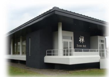
Zen Hall (坐禅堂の外観)