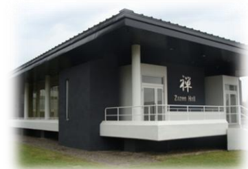
Zen Hall (坐禅堂の外観)